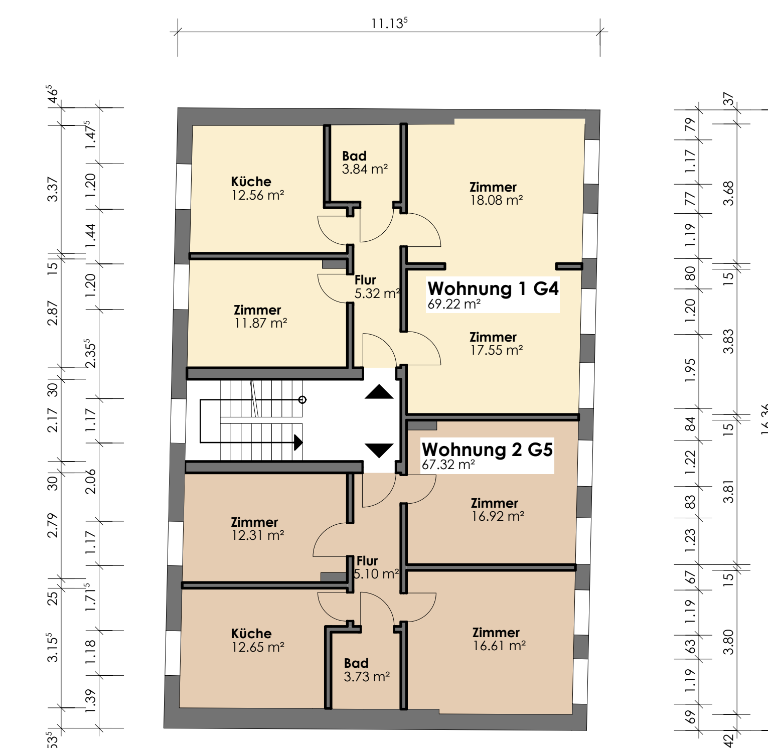
3. OBERGESCHOSS Gerichtsstraße 4